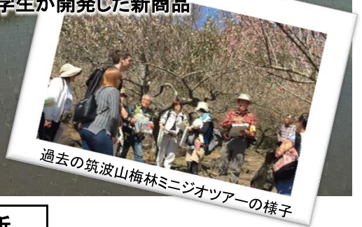
過去の筑波山梅林ミニジオツアーの様子