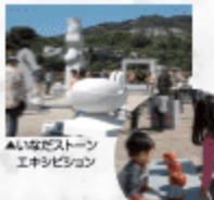
▲いなだストーン エキシビション