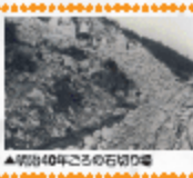
▲明治40年ごろの石切り場