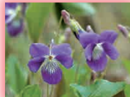
ニオイタチツボスミレ