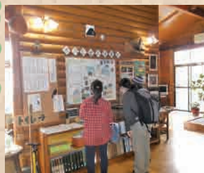
1階の資料コーナー

雪入ふれあいの里公園では、観察会など自然を楽しむ行事を開催しています。詳しくは、ホームページをご確認ください。