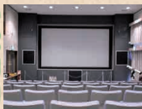
立体ハイビジョンシアター室 (上映時間と内容は、お問い合わせください)

ジオラマ展示や迫力のある映像で自然が楽しめる立体ハイビジョンシアターなどを備えた、雪入ふれあいの里公園の中心となる施設がネイチャーセンターです。ここで、自然の知識を少しだけインプットして、小さな旅に出かけてみませんか？森の仲間達が待っています。