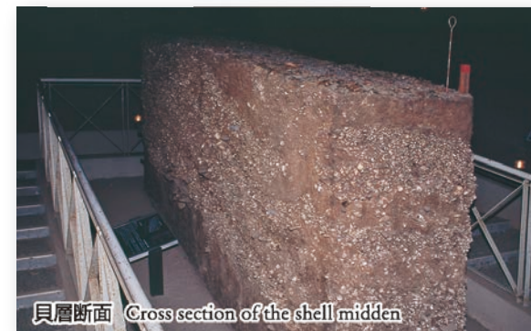
貝層断面 Cross section of the shell midden