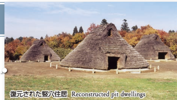
復元された竪穴住居 Reconstructed pit dwellings