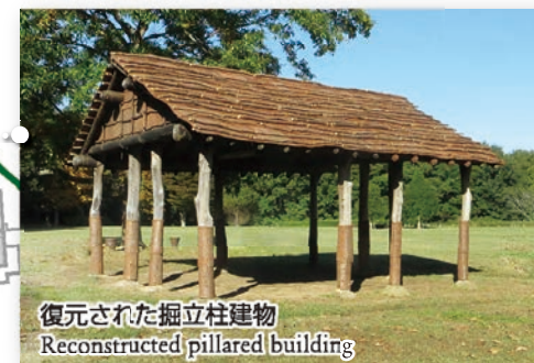
復元された掘立柱建物 Reconstructed pillared building