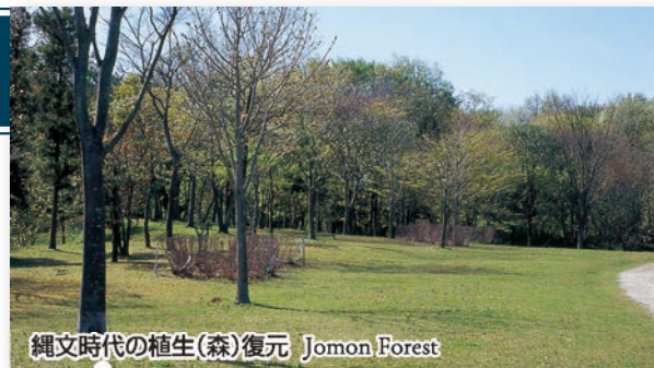
縄文時代の植生(森)復元 Jomon Forest

A large amount of food remains and artifacts were excavated including shells, bones, potteries and stone tools. Potteries for manufacturing salt were also unearthed. These items are on display at the Museum. Reconstructed pit dwellings, pillared building and graves are exhibited in the outdoor space.