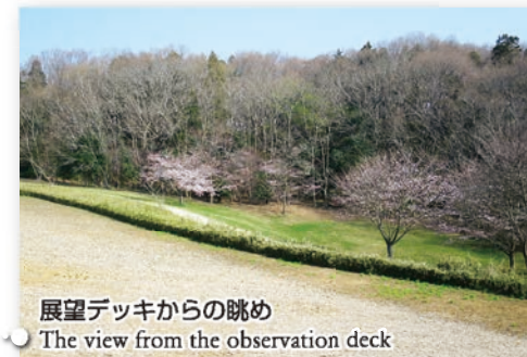
展望デッキからの眺め The view from the observation deck