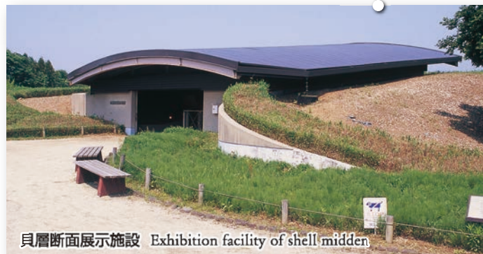
貝層断面展示施設 Exhibition facility of shell midden