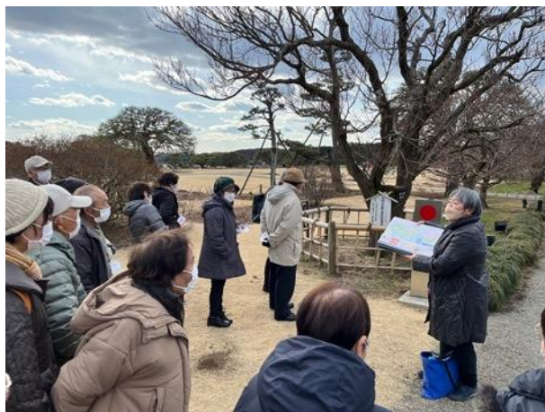
図 11 筑波交流センター 寿大学