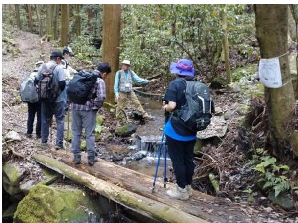
図 14 初夏の小町山・朝日峠登山