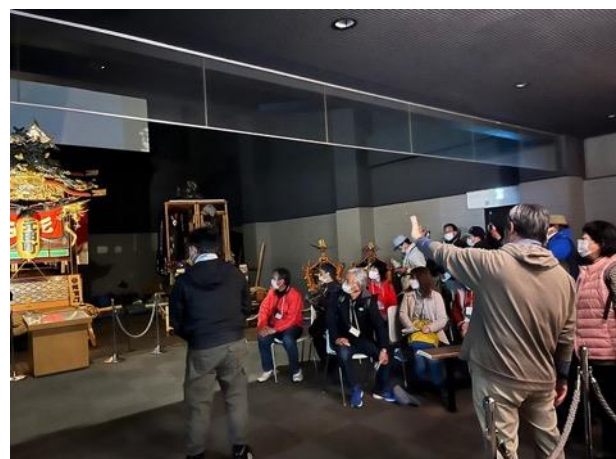
図 32 山あげ会館見学