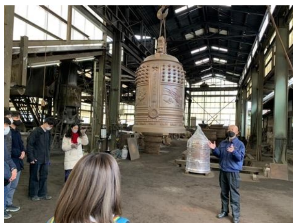
図9 筑波大学「ジオパーク論」