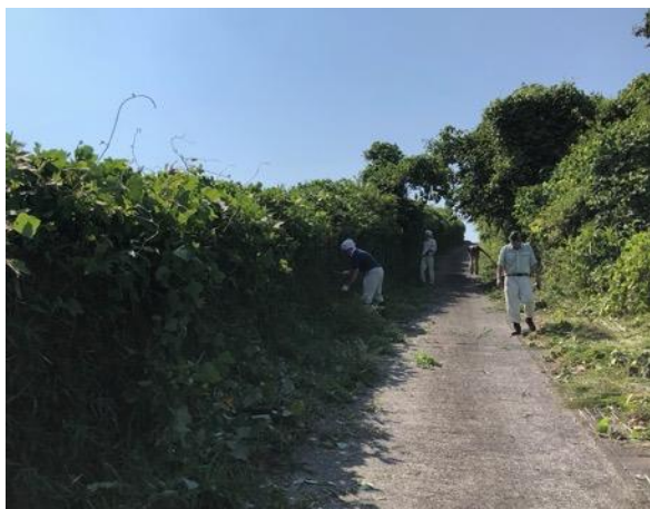
図2 石岡市龍神山の清掃活動