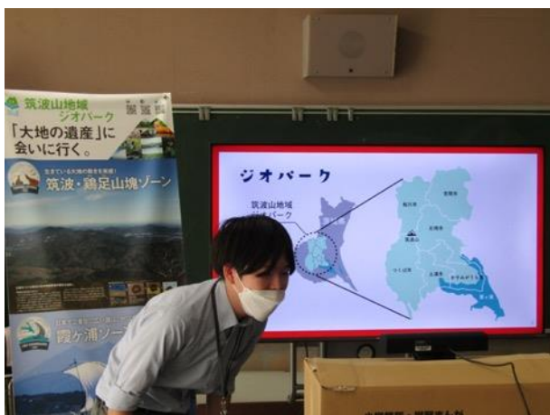
図6 石岡市立府中小学校出前授業