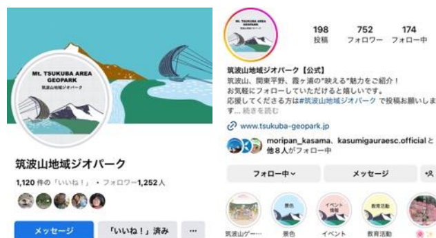
図 20 筑波山地域ジオパーク SNS

令和5年（2023年）3月23日時点 前年令和4年（2022年）4月9日との比較