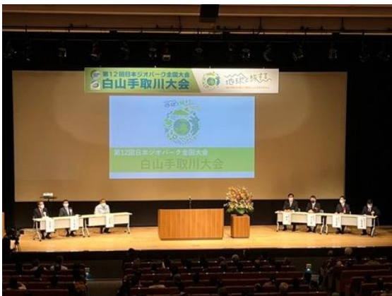
図27 全国大会 開会式