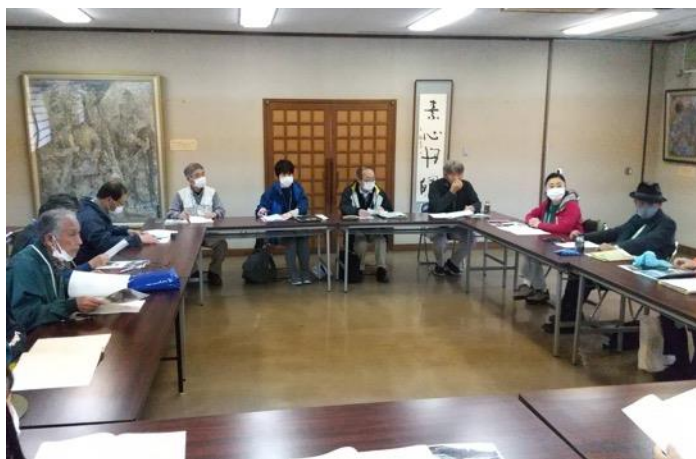
図 19 市民活動部会