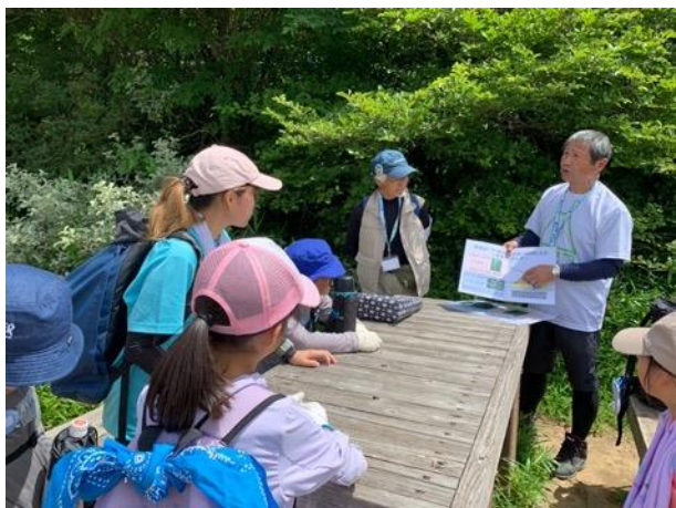
図 10 ミーム保育園筑波山登山