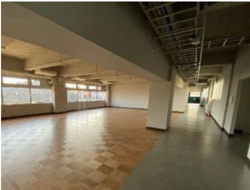
図25 改修工事完了後の様子