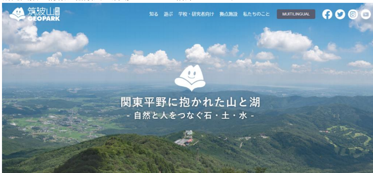
図 21 新しい協議会ウェブサイトのトップページ

筑波山地域ジオパークのウェブサイトのリニューアルを実施した。リニューアルにあたり、サイト内に「知る」「遊ぶ」「学校・研究者向け」「拠点施設」「私たちのこと」の5つの項目を設け、筑波山地域ジオパークの地域資源の情報、楽しみ方、学校教育支援プログラム及び研究支援の情報、協議会の活動をそれぞれ紹介している。