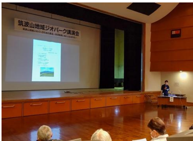
図 12 筑波山地域ジオパーク講演会