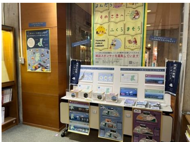
図 22 つくば市立中央図書館展示