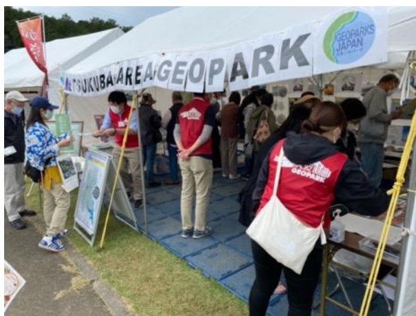
図 23 第 11 回笠間浪漫