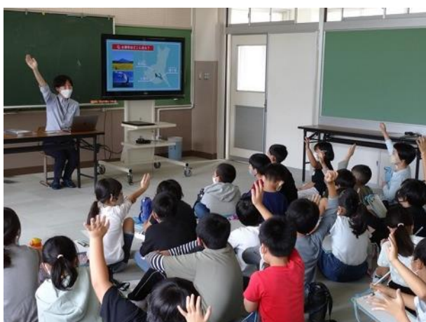
図8 土浦市立右舂小学校出前授業