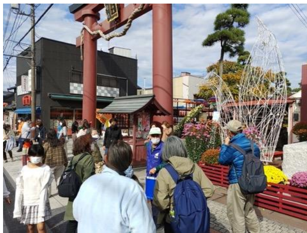
図 15 いばらきよいとこプラン