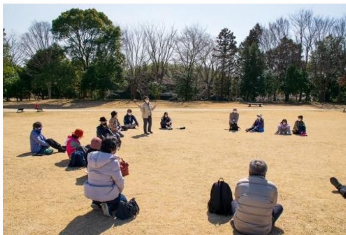
図 13 つくば市 自然環境教育事業