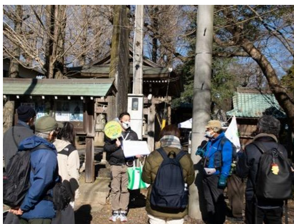
図 17 上郷ジオツアー