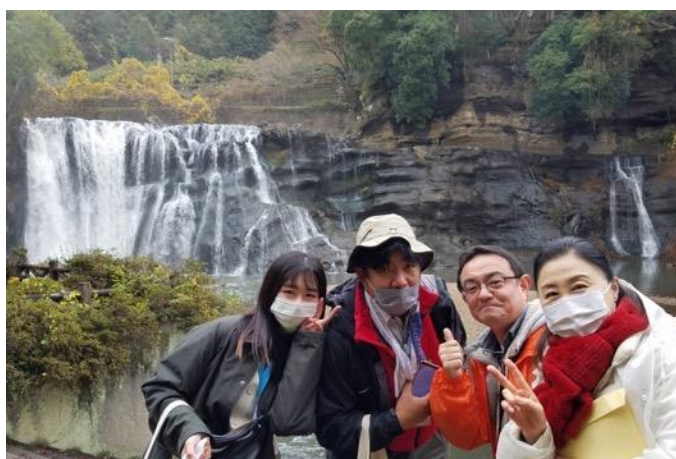
図 34 龍門の滝