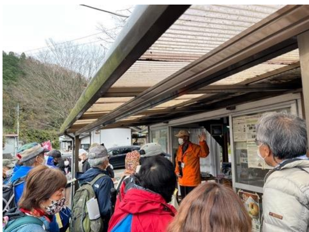
図 33 龍門の滝案内所