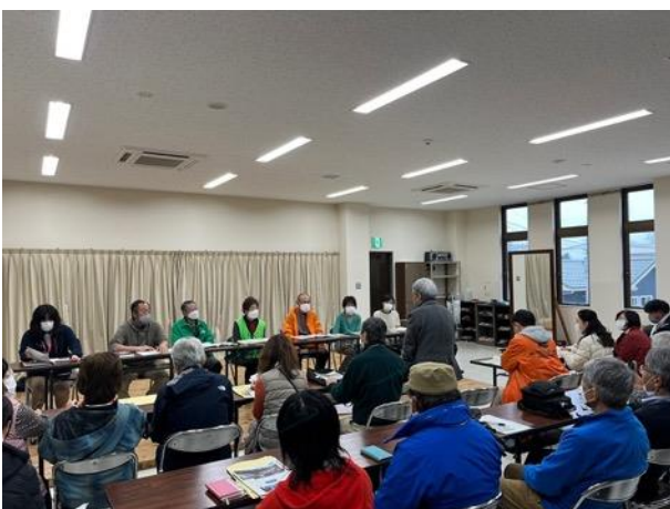
図 31 交流会