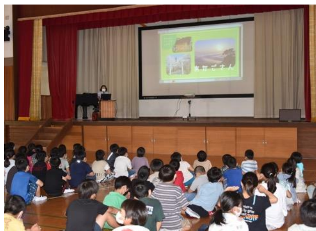
図7 笠間市立友部第二小学校出前授業