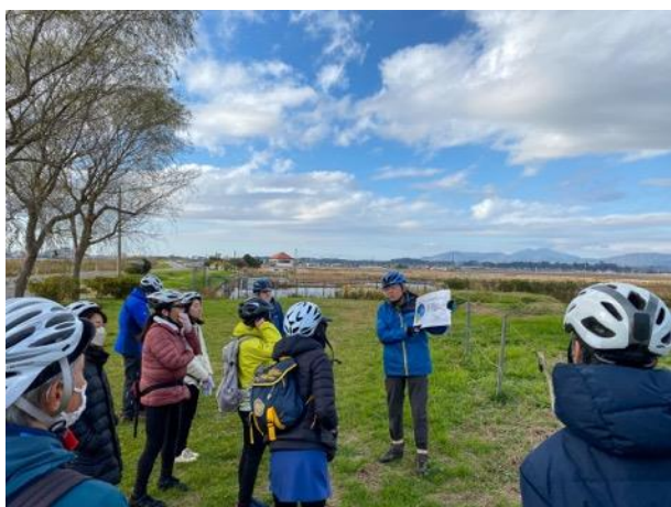
図 16 船と自転車で霞ヶ浦を楽しもう！