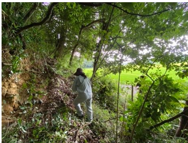
図3 つくば市六斗の森キャンプ場の清掃活動