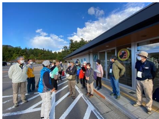
図30 全国大会 ポストジオツアー