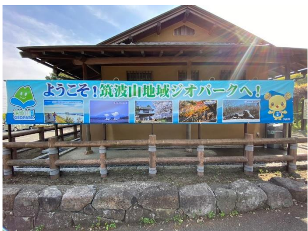
図 24 土浦市小町の館の歓迎板