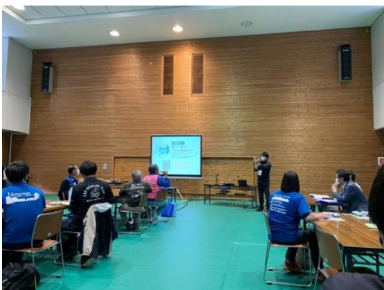
図29 全国大会 分科会