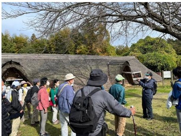
図 18 市民活動部会ミニジオツアー