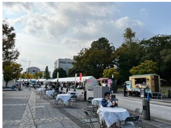
図28 全国大会 マルシェ