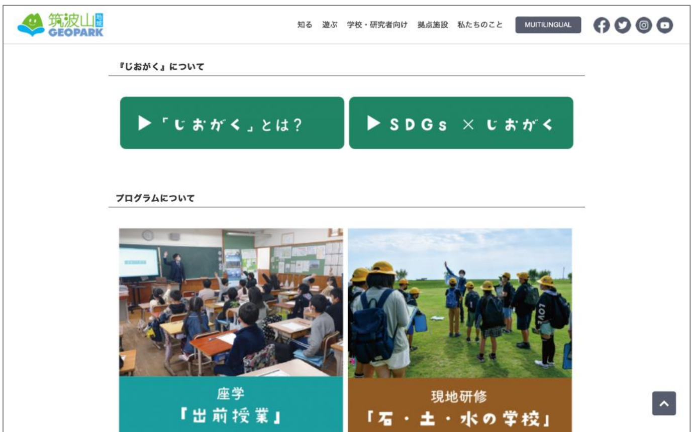
図5 ホームページに掲載した学校教育支援プログラムのページ

教育支援プログラムをホームページに掲載した（図5）。また、令和4年度（2022年度）は教育支援プログラムの周知活動を1件実施した。